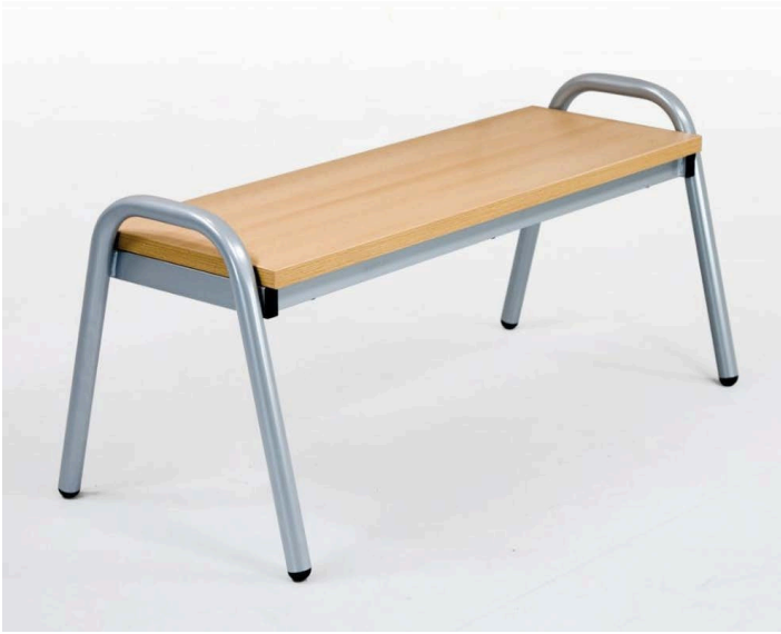
Zitbank - stapelbaar